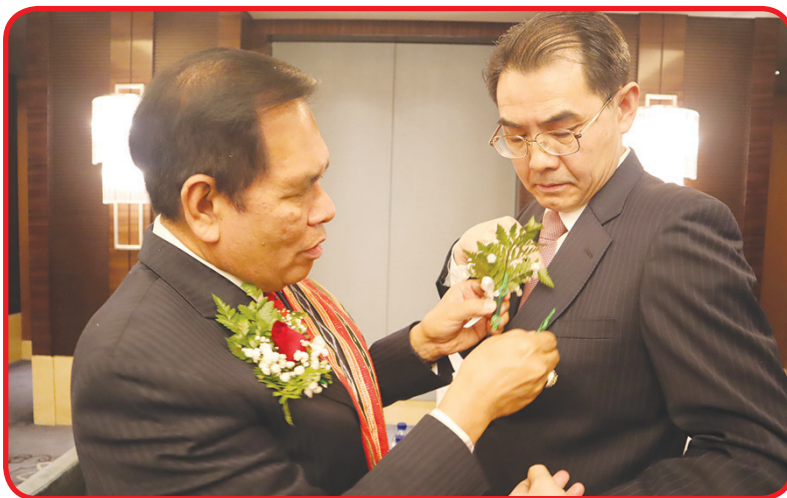
TAMU KEHORMATAN: Dubes Djauhari Oratmangun (kiri) memasang bunga di dada ke Asisten Menteri Luar Negeri Tiongkok Wu Jianguo yang menjadi tamu kehormatan dalam acara Resepsi Diplomatik HUT ke-75 RI di Beijing.

Dubes Djauhari mengatakan, di tengah pandemi, peningkatan kerja sama dua arah di bidang perdagangan, investasi, dan kerja sama penanggulangan Covid-19