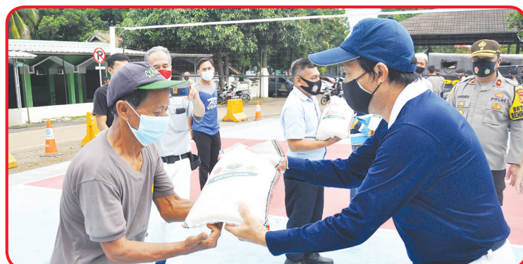
SERAHKAN BERAS: Yayasan Tzu Chi bersama dengan An Da Group, Sinar Mas Group dan Salim Group akan menyerahkan 5000 ton beras kepada warga terdampak wabah corona di 34 provinsi.