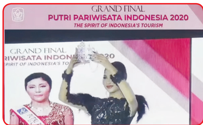
Putri Pariwisata 2019, melakukan prosesi pemberian mahkota ke Putri Pariwisata 2020.

tidak dipungkiri bahwa selebgram yang satu ini tidak hanya cantik dari penampilan luar, namun juga memiliki pengetahuan yang luas. Terbukti dari karantina