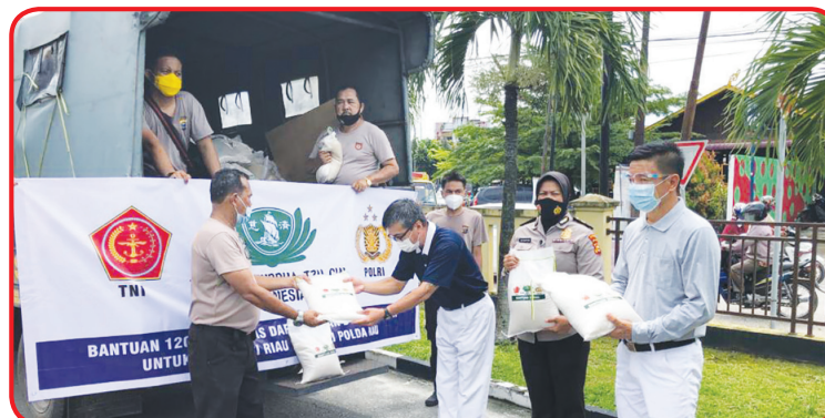
SERAHKAN BERAS: 120 ton beras akan diserahkan kepada provinsi Riau.