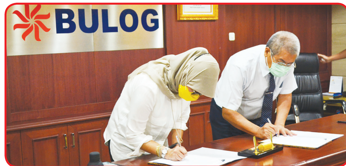
TANDATANGANI: Yayasan Tzu Chi dan BULOG (18/11) lalu menandatangani kesepakatan kerjasama pembelian beras berkualitas.