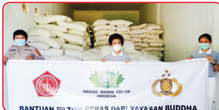
SERAHKAN BERAS: 150 ton beras (4/12) lalu diserahkan kepada Kapolda Sulawesi Utara.