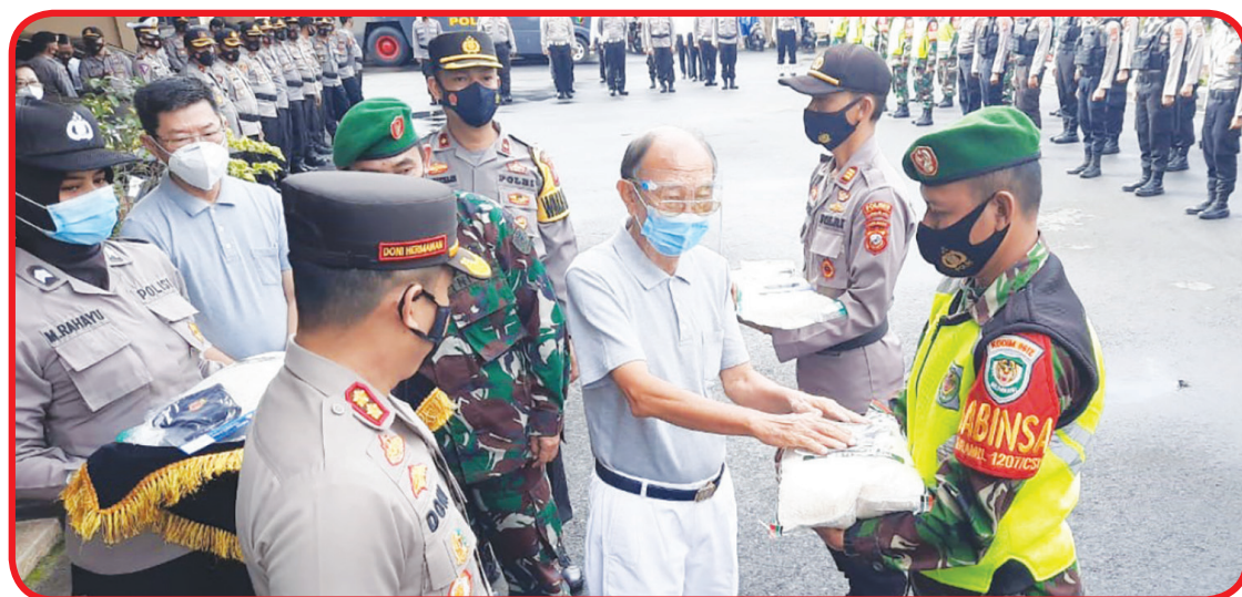
SERAHKAN BERAS: Relawan Tzu Chi Tasikmalaya menyerahkan beras cinta kasih. Pihak Polri bertanggung jawab menyerahkan 2200 beras masing-masing 5 kilogram.

ton. Kemudian pihak Polres akan mengirimkannya kepada masyarakat yang membutuhkan. Kapolda Jabar Irjen Pol Ahmad Dofiri Kamis (3/12) secara simbolis menyerahkan beras cinta kasih kepada Polres dan Polsek. Irjen Pol Ahmad Dofiri berharap setiap kantong beras yang diserahkan dapat dikirimkan kepada warga masyarakat yang benar-benar membutuhkan. "Ini adalah bentuk cinta kasih kami. Diharapkan warga masyarakat terdampak wabah corona dapat menerima bantuan ini." Polda Jawa Barat akan membagikan 390 ton beras cinta kasih. Beras tersebut diserahkan kepada Wakapolda Jatim Brigjen Pol. Drs. Slamet Hadi Suprptooyo. "Yayasan Tzu Chi Indonesia telah beberapa kali menyerahkan bantuan cinta kasih. 390 ton beras ini akan kami serahkan ke 39 Polsek. Sehingga mereka dapat menyenangkakan warga terdampak wabah corona." Demikian diungkapkan Kombes Pol Trunoyudo Wisnu Andiko dimutasi sebagai Analis Kebijakan Madya Bidang Penmas Divhumas Polri. • idn/din