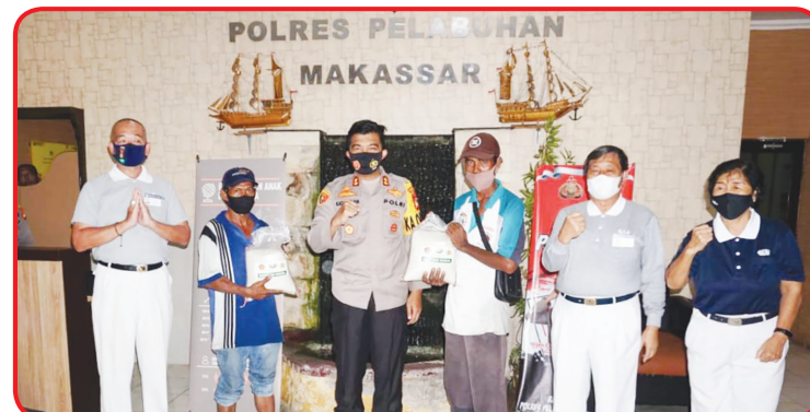
SERAHKAN BERAS: 250 ton beras akan diserahkan kepada provinsi Makassar. Beras tersebut akan diserahkan kepada Polda Sulawesi Selatan.